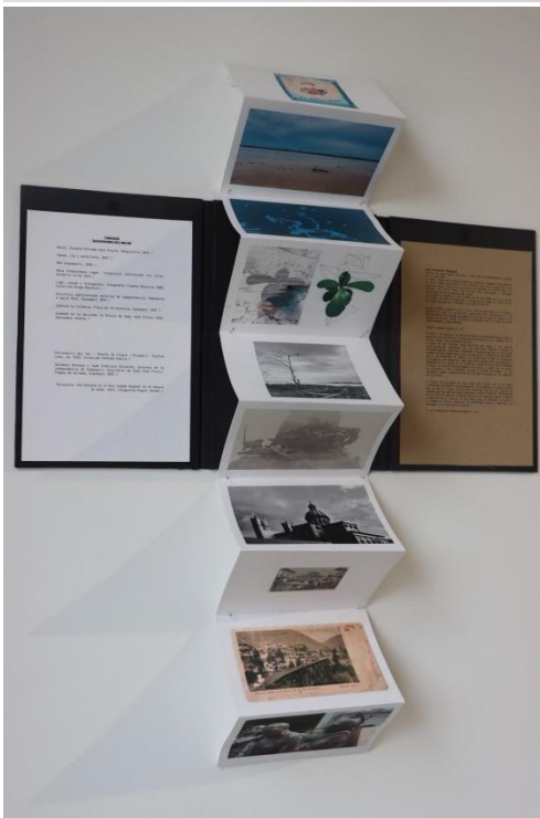
Ilustración 2 La obra se refiere a 5 historias violentas vinculadas a Guayaquil, que tienen poca cabida en el imaginario colectivo, en diálogo con mi propio archivo fotográfico y artistas cercanos a mi quehacer.

Consiste en 5 fotos creadas, 5 miniaturas de referencia, y 5 series de fotos de mi propio archivo del cual exploro no el dato sino el gesto que me comunica con cada historia. Las 5 fotos creadas a partir de esos diálogos, son un gesto de mímica, que pretende crear una imagen que no ha existido. De esos tanteos realizados en mi archivo y en distintos textos, de las historias enmascaradas u olvidadas, van surgiendo líneas en común que empiezan a comunicarse entre sí, tanto visualmente, como en contenidos, vinculándose con la historia social y la mía propia.